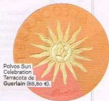
Polvos Sun Celebration Terracota de Guerlain (66,80 €).