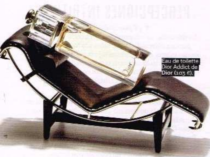
Eau de toilette Dior Addict de Dior (1.03 €).