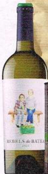
Vino blanco REBEL'S DE BATEA (8,35 €).

Chips de frutas Adrian's Choice para DELISHOP (5,50 €).