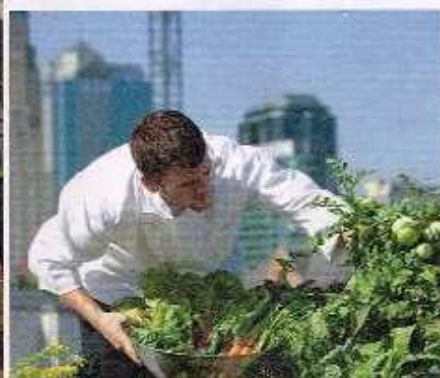
Hotel Omm, Barcelona.