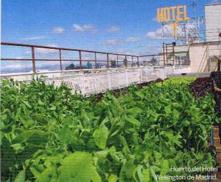
Huerto del Hotel Wellington de Madrid.

El huerto en la azotea del Wellington "alimentará" a su nuevo restaurante.