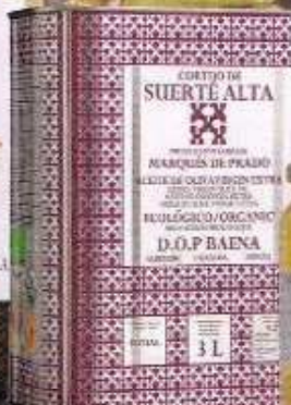
Lata 3 litros aceite Picual SUERTE ALTA (31,35 €).